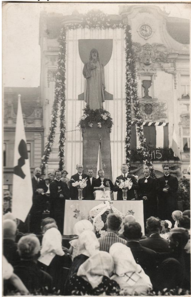
Husovy oslavy v Berouně r. 1938