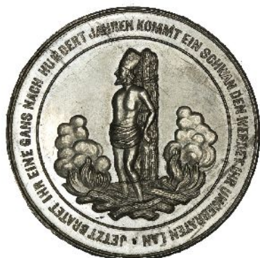
Hus prorokuje Lutherův příchod (1883)