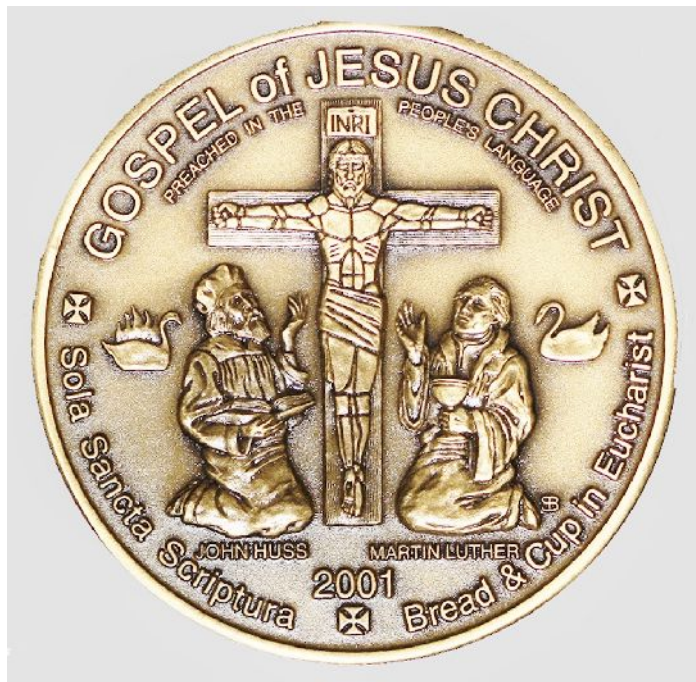
Hus s Lutherem se modlí pod křížem, za Husem hoří husa

Karmelitánské nakladatelství Kostelní Vydří 2015, 319 stran