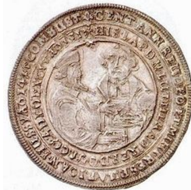
Hus s Lutherem (1617)