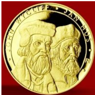
Hus s Wicliffem (2011)