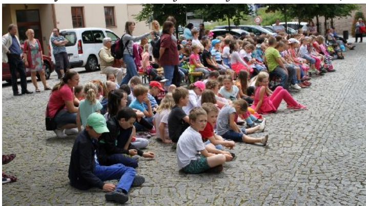
a jeho diváci

Ale Jeronýmův život se již chýlí ke konci - či k svému vyvrcholení? Ve snaze pomoci Husovi míří do Kostnice. Do bran města vstupuje 4. dubna 1415. Když však zjišťuje situaci, již 9. dubna prchá, u hranic je rozpoznán, zatčen a 23. května v okovech znovu přivezen do města. Vězení je tak tvrdé, že hrozí nebezpečí, že zemře dříve, než bude moci být upálen. Poté, co v plamenech vyznavačsky umírá Hus, se koncil soustředí na Jeronýma. Stejně jako tomu bylo u Husa, nejvíce mu přitápějí čeští odpůrci. Naproti tomu někteří vynikající teologové té doby, jako kardinálové Francesco Zabarella a Petr d'Ailly, se snaží Jeronýma přesvědčit k odvolání. Odvolání kacíře je větším trumfem, než jeho smrt. Jeroným, ořesený smrtí přítele, volí mezi potupnou smrtí v případě věrnosti Husovi, Wiclifovi a vlastnímu učení a potupným životem v případě odvolání a zrady dosavadní víry. Jeroným, na jednu stranu zastrašen, na druhou ovlivněn přátelským chováním a zájmem některých svých soudců, se naklání k odvolání a v průběhu září 1415 se postupně víc a více zříká koncilem odsouzených Husových a Wiclifových "bludů". "Bál jsem se jako člověk ohně,