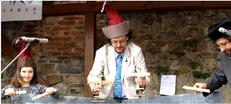
loutkové představení Jeronýmova života

Václavem IV., který znamenal odchod cizích profesorů i studentů, což sice mělo za následek krátkodobý vzestup teologie, která v Českém království spoluurčovala i politické dění, ale i dlouhodobý úpadek celé Karlovy univerzity.