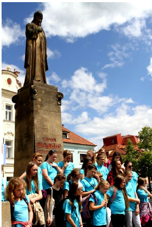
Soubor Krákorky před pomníkem Mistra Jana Husa